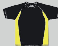
black - fluo

Die DRYPOWER Micropolyester Materialien und die verwendeten Farben sind durch unabhängige Testinstitute (ÖKOTEX/ SGS) getestet und unbedenklich. Unsere Produktionsstätten folgen den internationalen Auflagen und sind zertifiziert.