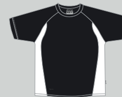
black - white