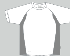
white - coolgrey