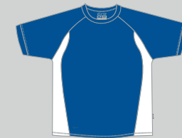
royalblue - white