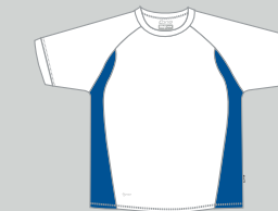
white - royalblue