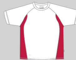
white - red