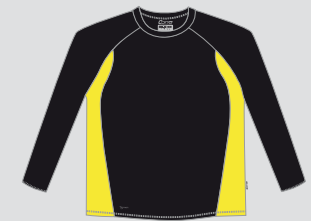
black / Nr. 12 - neonyellow / Nr. 36