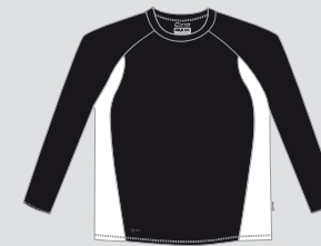
black / Nr. 12 - white / Nr. 1