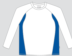
white / Nr. 1 - royalblue / Nr. 20