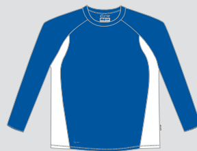
royalblue / Nr. 20 - white / Nr. 1

Die DRYPOWER Micropolyester Materialien und die verwendeten Farben sind durch unabhängige Testinstitute (ÖKOTEX/ SGS) getestet und unbedenklich. Unsere Produktionsstätten folgen den internationalen Auflagen und sind zertifiziert.