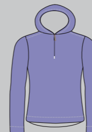
lilac / icegrey Nr.: CSL07-1930