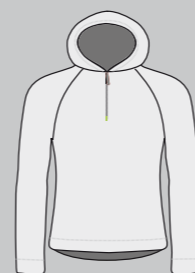
icegrey / coolgrey Nr.: CS07-3011