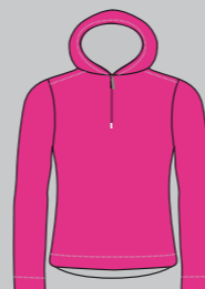
magenta / icegrey Nr.: CSL07-0730