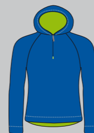
royalblue / lime Nr.: CS07-2022