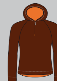
choco / orange Nr.: CS07-4203