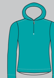
teal / icegrey Nr.: CSL07-4530