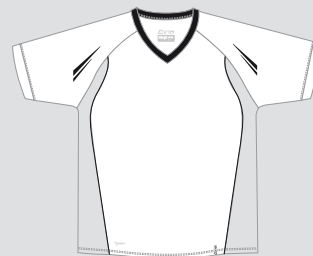
white / Nr. 1 - black / Nr. 12 Nr.: CS06-0112