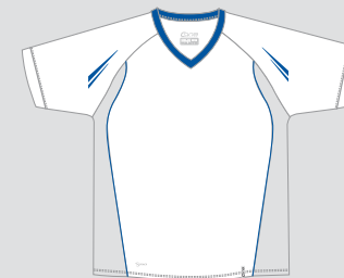
white / Nr. 1 - royalblue / Nr. 20 Nr.: CS06-0105