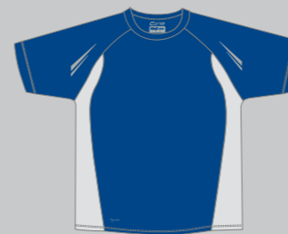
34 INKBLUE - GREY AIRMESH