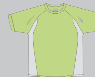
47 APPLGREEN - GREY AIRMESH