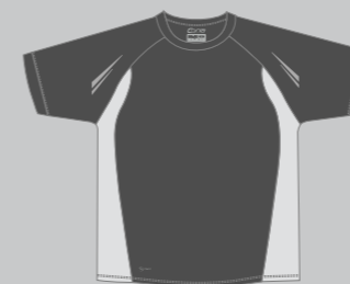
46 ANTHRAZIT - GREY AIRMESH