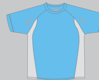
38 CLEARBLUE - GREY AIRMESH