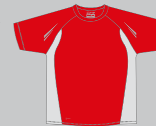
26 LOBSTERRED - GREY AIRMESH