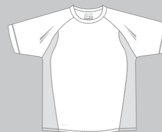
01 WHITE - GREY AIRMESH